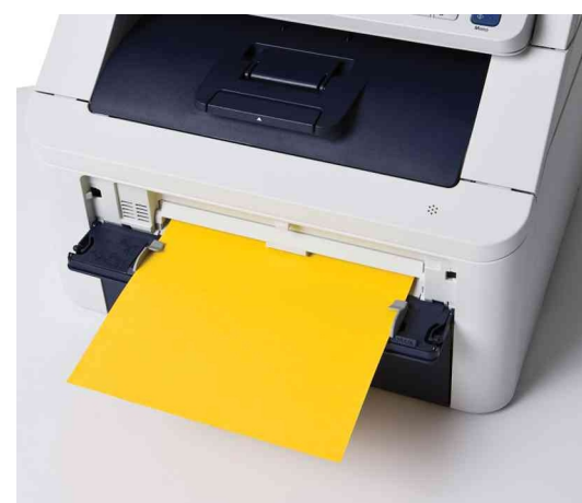
Stampa su carta spessa o buste.

Il risparmio di tempo e dei costi è garantito con l'innovativo DCP-9010CN che offre semplici soluzioni per la gestione professionale dei documenti.