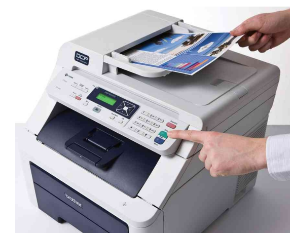
ADF: ideale per la scansione e la copia di documenti composti da più pagine.